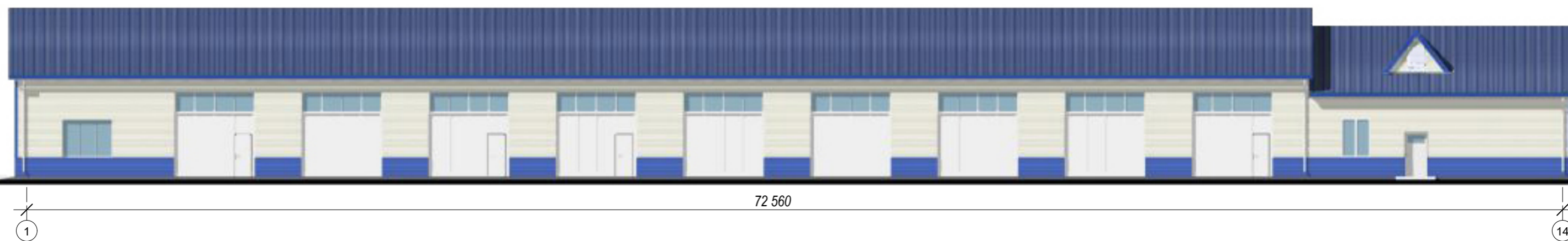
Фасад по оси "Д"